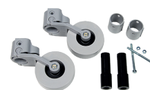
Rueda trasera con freno por presión